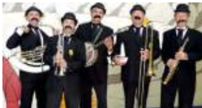
L'Orchestre Rétro de la Belle Epoque et des Années Folles 1900-1920