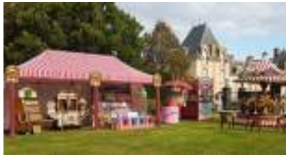
PETITE FETE FORAINE de LUXE avec Carrousel, Stands, Orgue et Gonflable...