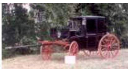
VOITURE COUPE DE VILLE 1900 AVEC ATTELAGE