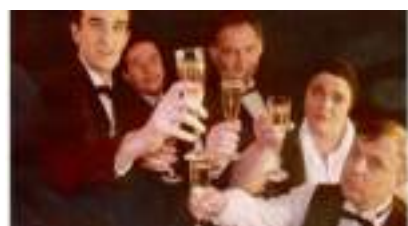
Faux Serveurs : la folle soirée des PIQUE-ASSIETTES