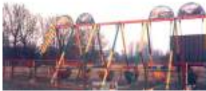
Balançoires à l'Ancienne de Parc Années 1930/1940