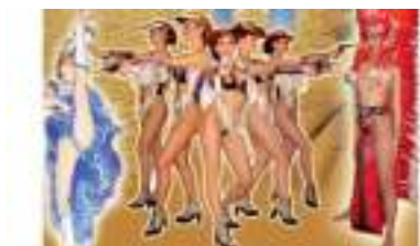
SOIREE SPECTACLE FAR WEST : CANCAN WESTERN