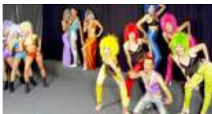
CHŒURS DE STARS : UN SIECLE DE REVUES AU MUSIC HALL