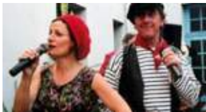
ORCHESTRE MUSETTE : le Groupe Guinguette de l'Accordéon en Chansons