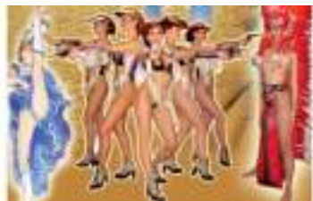
SOIREE SPECTACLE FAR WEST : CANCAN WESTERN