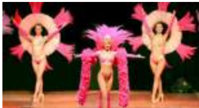
SPECTACLE DE MUSIC-HALL : CABARET PARIS PRESTIGE