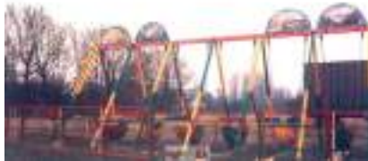
Balançoires à l'Ancienne de Parc Années 1930/1940