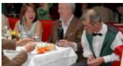
LES EXTRAS : faux serveurs fous pour repas ou cocktail