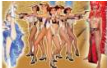
SOIREE SPECTACLE FAR WEST : CANGAN WESTERN