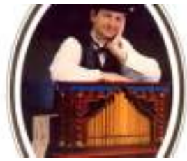
LE SAINT VALENTIN: ORGANISTE DE L'AMOUR