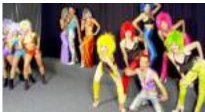
CHŒURS DE STARS : UN SIECLE DE REVUES AU MUSIC HALL