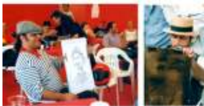
CARICATURISTES COSTUMES DE PARIS