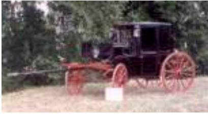
VOITURE COUPE DE VILLE 1900 AVEC ATTELAGE