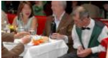
LES EXTRAS : faux serveurs fous pour repas ou cocktail