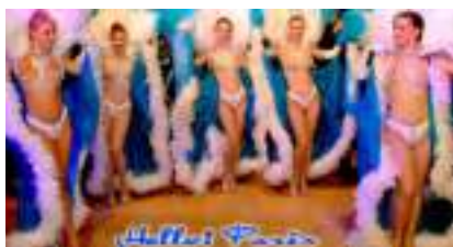
Soirée Spectacle Cabaret : Hello Paris French Cancan