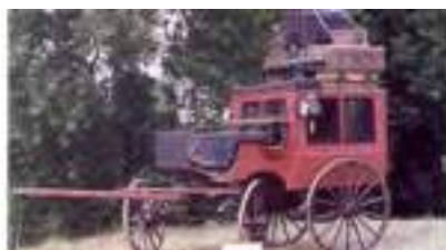
ATTELAGE OMNIBUS 1910