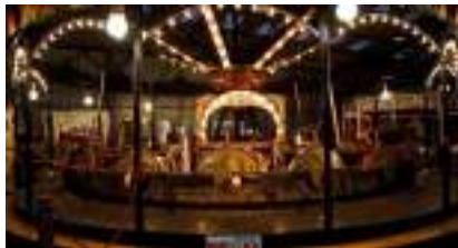
Le Manège Carrousel Vélocipède Authentique 1890