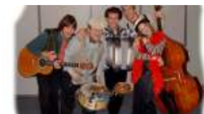
Orchestre Guinguette Musette Jazz Chansons Françaises : LES TITIS PARISIENS