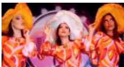
LA CITE DES ANGES : LES GRANDS SUCCES DU MUSIC-HALL