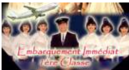
EMBARQUEMENT 1ère CLASSE : JEU SPECTACLE TOUR DU MONDE