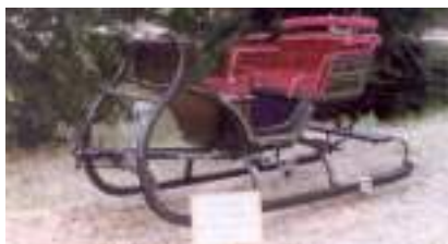
TRAINEAU DE NOEL 1905