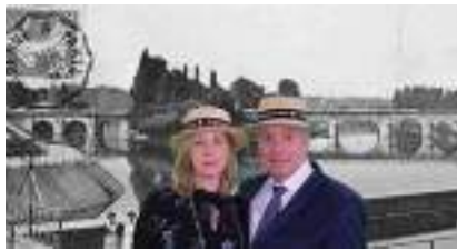
ANIMATION BORNE PHOTO RETRO Séniors 1900 PHOTOBOOTH sur fond vert