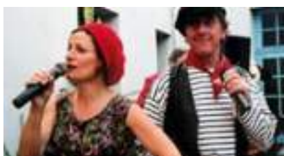
ORCHESTRE MUSETTE : le Groupe Guinguette de l'Accordéon en Chansons