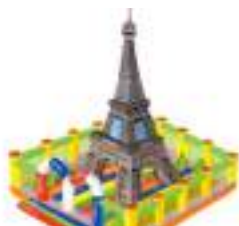
TOUR EIFFEL GONFLABLE