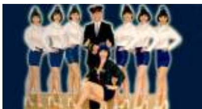
EMBARQUEMENT IMMEDIAT: SOIREE TOUR DU MONDE