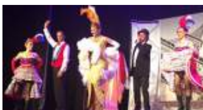
Spectacle Séniors : Le French CanCan en Comédie Musicale "LAURE DE PANAME"