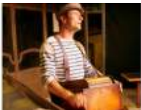
ORGUE de BARBARIE en spectacle : acteur et musicien de rue