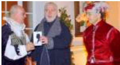
DOCTEUR SILHOUETTE: profil aux ciseaux