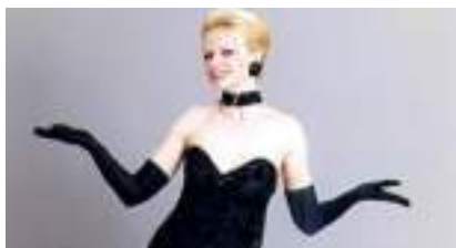
PIAF ET LE FOU CHANTANT: Hommage à la Môme et à Trénet