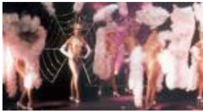
SPECTACLE CABARET Soirée Paradise Vingtième Siècle