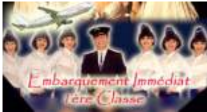
EMBARQUEMENT 1ère CLASSE : JEU SPECTACLE TOUR DU MONDE