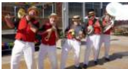
JAZZ NEW ORLEANS B.B.B. Orchestre de Parade Nouvelle-Orléans Swing