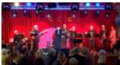
ORCHESTRE VARIETES PRESTIGE : Chanson francaise Rock Soul Jazz