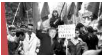
STUDIO PHOTO MAI 68 QUARTIER LATIN BARRICADES PARIS REVOLUTION