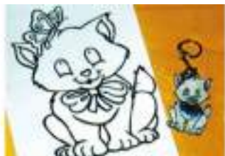
ATELIER PLASTIC FOU COO COCARDE ETC