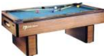
LOCATION BILLARD AMERICAIN