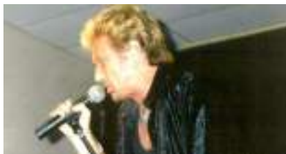
SOSIE JOHNNY HALLYDAY