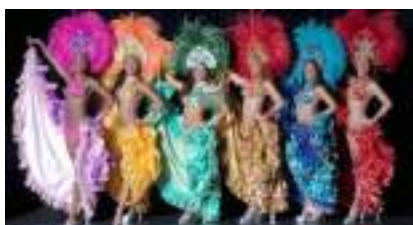
TROUPE BRESILIEUNE pour DEFILE SPECTACLE ou SOIREE Samba CARNAVAL