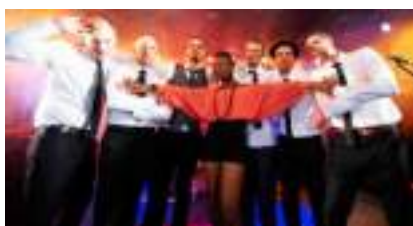
ORCHESTRE FUNKY SOUL TOP