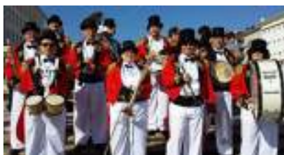
FANFARE du CIRQUE : Orchestre ROYAL LOYAL