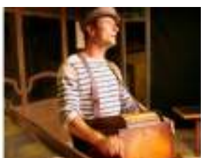
ORGUE de BARBARIE en spectacle : acteur et musicien de rue