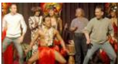
SHOW TAHITIEN Vahinés et Cocotiers