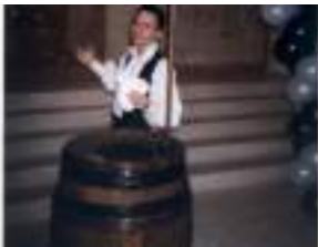
CAPITAINE MAGIQUE et son tonneau: cartes atout coeur de pirate!