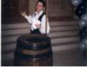
CAPITAINE MAGIQUE et son tonneau: cartes atout coeur de pirate!