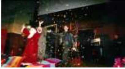
Spectacle de Magie pour Arbre de Noël : MARC LE MAGICIEN INTENSE