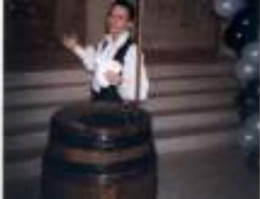
CAPITAINE MAGIQUE et son tonneau: cartes atout coeur de pirate!