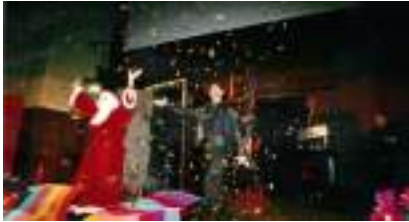
Spectacle de Magie pour Arbre de Noël : MARC LE MAGICIEN INTENSE