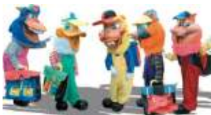
LA RENTREE DES TOONS: la joyeuse école en bande dessinée