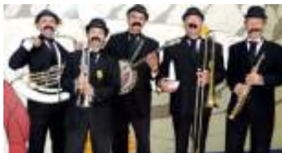
L'Orchestre Rétro de la Belle Epoque et des Années Folles 1900-1920