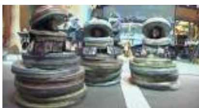
LES EMOBINEURS DE FESTIVAL