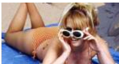
SOSIE BRIGITTE BARDOT