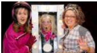
LES AVANT PREMIERES