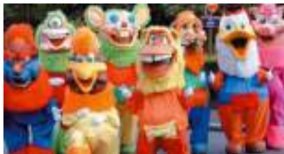
CARNAVAL TOONS BD