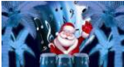
SPECTACLE de NOEL Musical Familial et Féérique : CIRCUS BONGO PARADE !