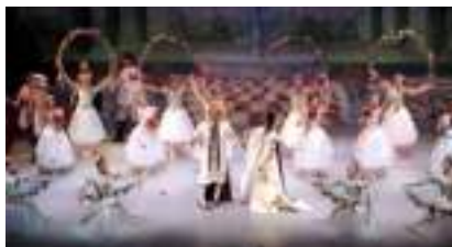
LA BELLE AU BOIS DORMANT: musique de Tchaïkovski conte de Perrault et Grimm