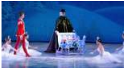
CASSE-NOISETTE : le ballet féérique