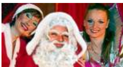
LA LEGENDE DU PERE NOEL