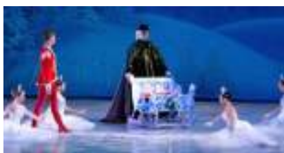
CASSE-NOISETTE : le ballet féérique