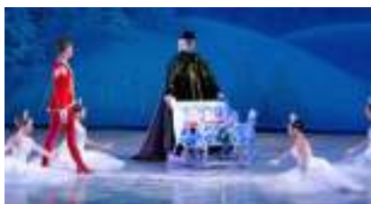
CASSE-NOISETTE : le ballet féérique