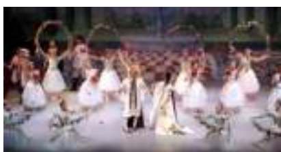
LA BELLE AU BOIS DORMANT: musique de Tchaïkovski conte de Perrault et Grimm