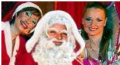
LA LEGENDE DU PERE NOEL