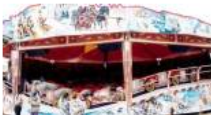
Manège de la Chenille Foraine ou Music Express