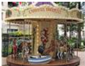
LE MANEGE CARROUSEL DU JARDIN DE BAGATELLE