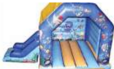
MER REMONTEE GONFLABLE