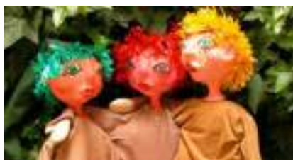
LE FABULEUX LIVRE DE LULU BERLU : dans la forêt des contes de Grimm et de Perrault