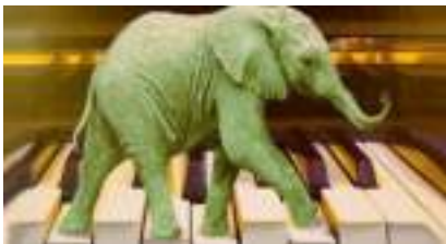
HISTOIRES DE BABAR : le Roi des Eléphants