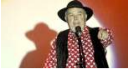
LES LETTRES DE MON MOULIN: la Provence de Daudet