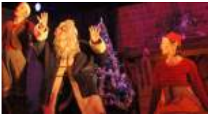
LA LEGENDE AUTHENTIQUE DU PERE NOËL