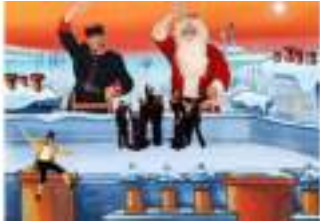
LE NOEL DES PETITS NETTOYEURS DE CHEMINEES