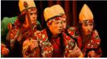
Voyages et Contes Fantastiques du Docteur GULLIVER