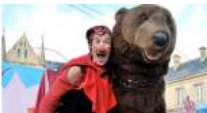
LA CLOWNESSE ET L'OURS: Nounours fait son Cirque