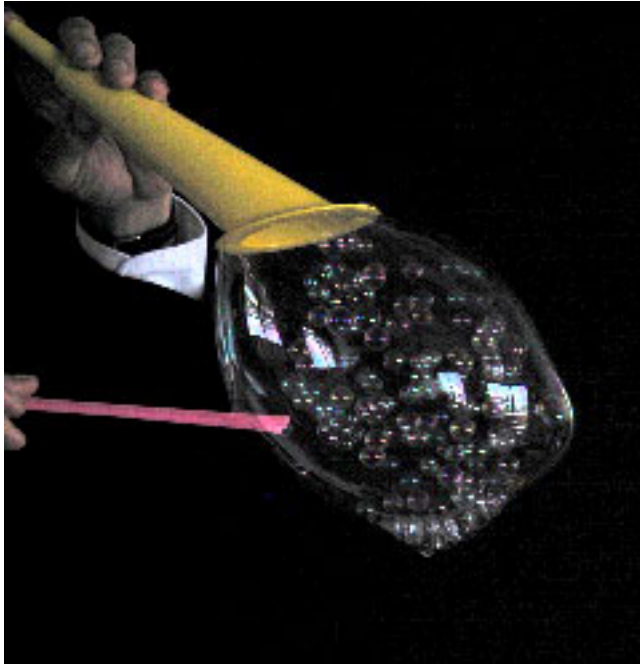
Chenille (bulles collées en chenille)