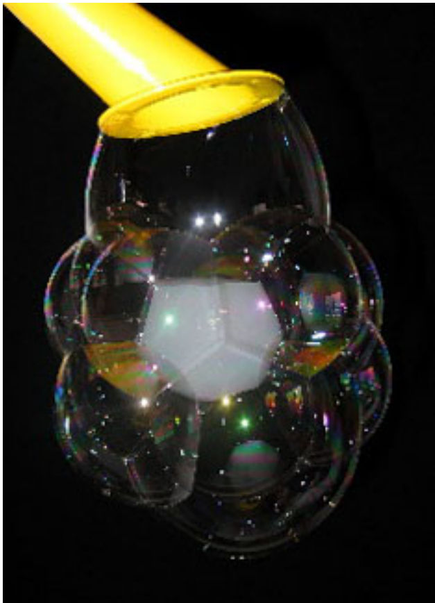
Grand kangourou (2 bulle de 40 cm dans laquelle on met des bulles de 5 cm)

Published on Monica Médias ( https://www.monica medias.com )