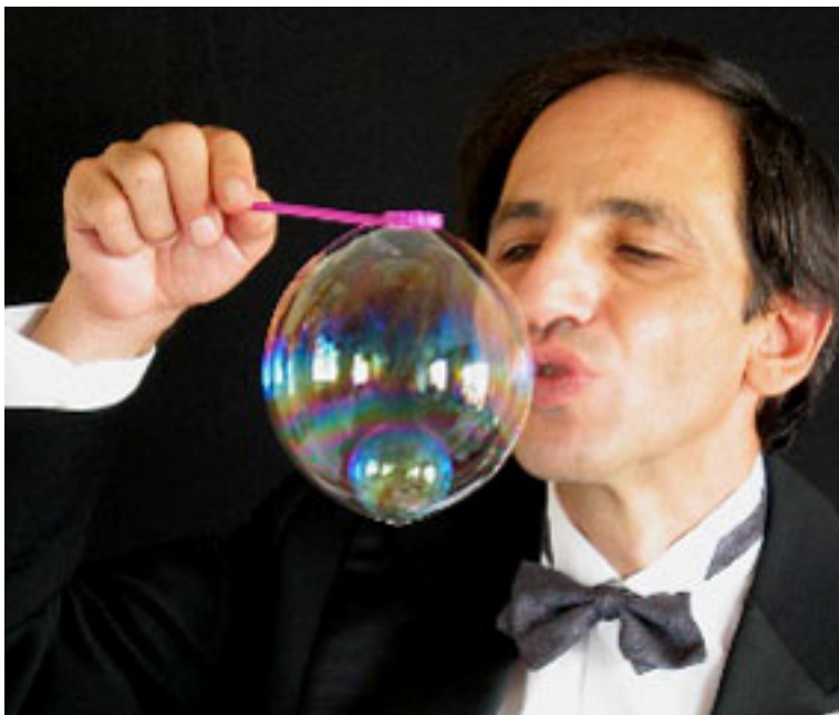
Loto (1 bulle de 20 cm avec à l'intérieur 20 bulles qui tournent)