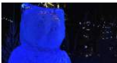
SCULPTEUR SUR GLACE pour votre Evènement 100% ICE de Janvier à Noël

Source URL: https://www.monicamedias.com/bulles-de-savon-souffleur-de-magie.html