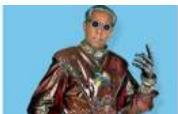
MIME ROBOT: androïde au ralenti