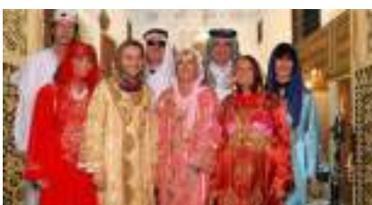
STUDIO PHOTO ORIENTAL