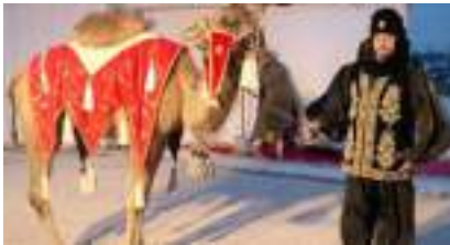
LES CAMELIDES Chameau Dromadaire