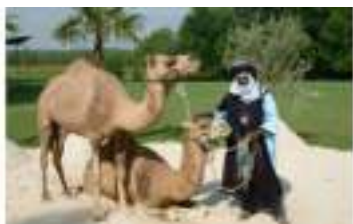
LA CARAVANE PASSE : défilé d'animaux d'Orient