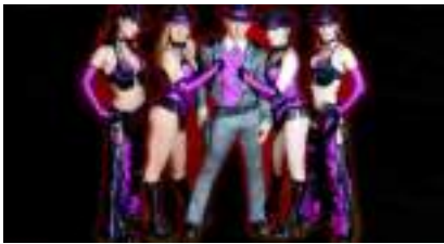
SHOW WESTERN WILD WEST et ses Mystères