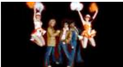
SHOW STARSKUTCH Police Los Angeles