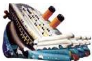
TOBOGGAN TITANIC GONFLABLE