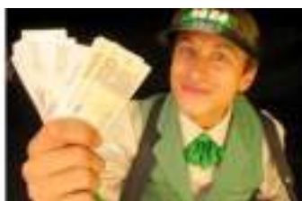
LES RIEN NE VA PLUS : casino poker et tricheurs