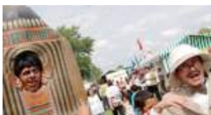
MOMIE FICTION D'EGYPTE : l'Antiquité des Pharaons et Pyramides en spectacle