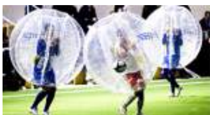
Football en Bulles : des Bubbles, des Ballons et des Buts