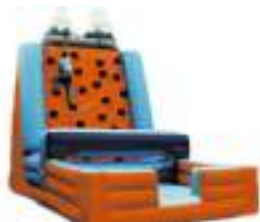
MONTAGNE D'ESCALADE GONFLABLE