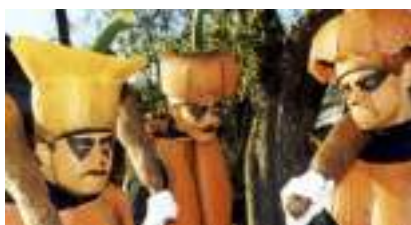
Chansons Halloween et Cucurbitacées Costumées : OUILLE LES CITROUILLES !