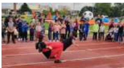
Village des SPORTS OLYMPIQUES : Location de Parc Multisport pour Animation Initiation Démonstration !