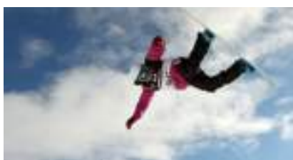
Snowboard Freestyle : une animation de glisseurs de l'extrême et brûleurs de planches !