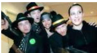
LES INCORRUPTIBLES MAFIEUX : borsalinos parrains et prohibition