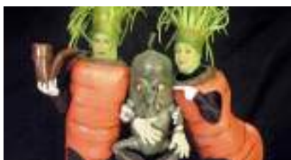
LES CAROTTES SAUTEES : légumes pour fantaisie bio