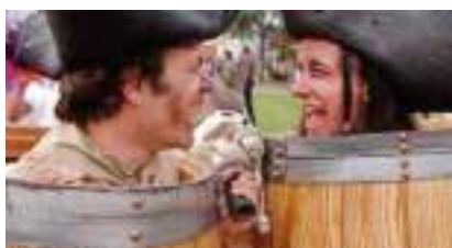
LES BARRIQUES PIRATES : Sketches bien Tassés à Boire au fil de l'Eau

Source URL: https://www.monicamedias.com/les-beach-brothers-soleil-surf-and-sea-de-polynesie.html