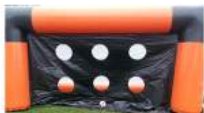
La Cible Foot Gonflable : Tirs aux Buts sur Coup-Franc ou Pénalty en mode Platini !