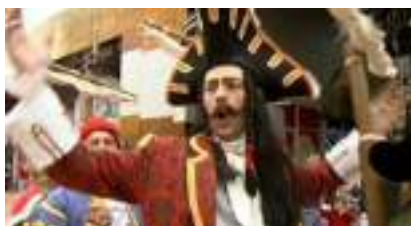
Comédiens Pirates et artistes improvisateurs des Mer : LES ECHOUES !