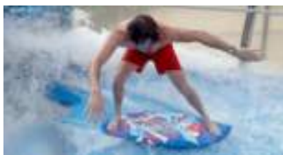
Skimboard : L'ANIMATION AQUATIQUE DE GLISSE