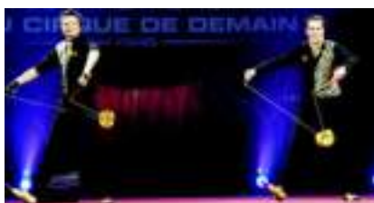
Jongleurs diabolos : GOLDEN TIME le cirque endiablé