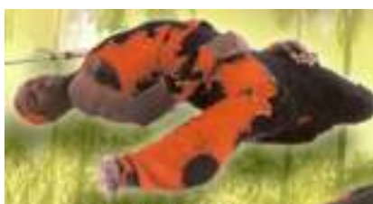
LIMBO STAR : DANSEUR ANTILLAIS POUR BARRE CREOLE