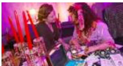
LA FEE CARTOMANCIENNE : tarot, voyance, chiromancie et lignes de la main, ying yang et numéologie