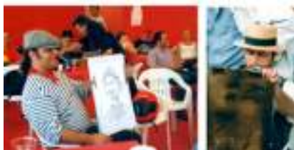
CARICATURISTES COSTUMES DE PARIS