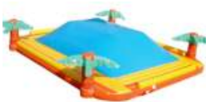
SUPER DUNE GONFLABLE