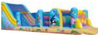
OCEAN PACIFIQUE GONFLABLE