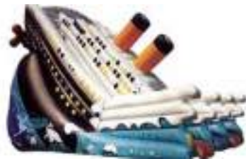
TOBOGGAN TITANIC GONFLABLE

Source URL: https://www.monicamedias.com/defi-arches-gonflables.html