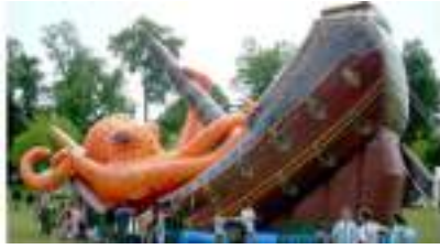
TOBOGGAN du GALION à la PIEUVRE GEANTE GONFLABLE