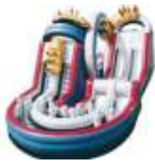
ROLLER COASTER GONFLABLE