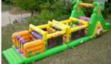
GRAND SAFARI GONFLABLE