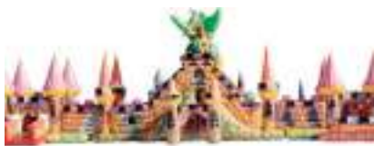
DONJONS DRAGONS GONFLABLE