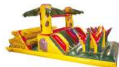
PARCOURS JUNGLE GONFLABLE