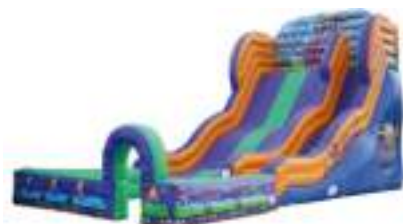
TOBOGGAN GEANT GRAND HUIT