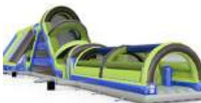
PARCOURS CHALLENGER TOBOGGAN GONFLABLE