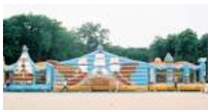
L'ÎLE AUX PIRATES GONFLABLE