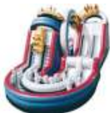
ROLLER COASTER GONFLABLE