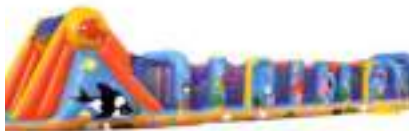
OCEAN GEANT GONFLABLE