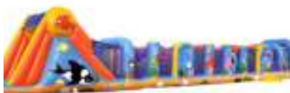
OCEAN GEANT GONFLABLE