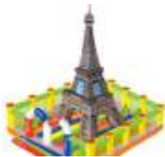
TOUR EIFFEL GONFLABLE