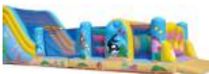
OCEAN PACIFIQUE GONFLABLE