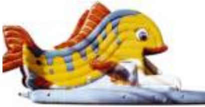
POISSON TROPICAL GONFLABLE