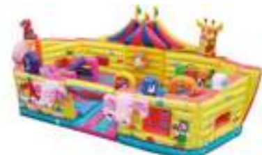
LE ZOO DU CIRQUE GONFLABLE