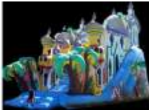
TOBOGGAN GEANT ORIENTAL