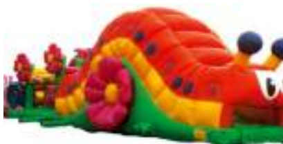
CHENILLE BUG RUN GONFLABLE