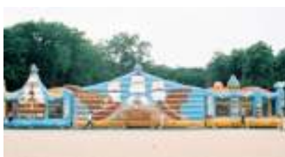
L'ÎLE AUX PIRATES GONFLABLE