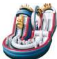
ROLLER COASTER GONFLABLE