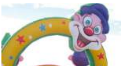
JOYEUX CIRQUE GONFLABLE