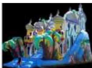
TOBOGGAN GEANT ORIENTAL