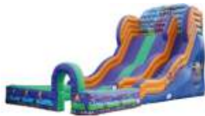
TOBOGGAN GEANT GRAND HUIT