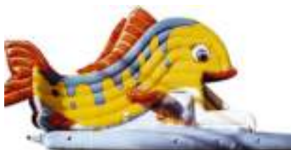
POISSON TROPICAL GONFLABLE