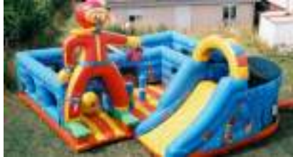
L'AVENTURE SOUS-MARINE GONFLABLE