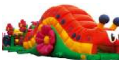
CHENILLE BUG RUN GONFLABLE