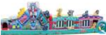
TRAIN DES ANIMAUX GEANT