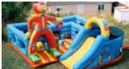
L'AVENTURE SOUS-MARINE GONFLABLE