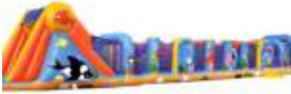
OCEAN GEANT GONFLABLE