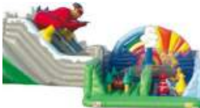
EXTREME GLISSE GONFLABLE