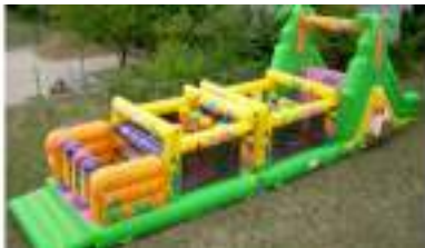
GRAND SAFARI GONFLABLE