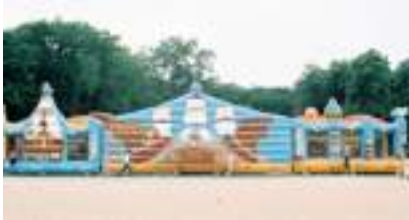
L'ÎLE AUX PIRATES GONFLABLE