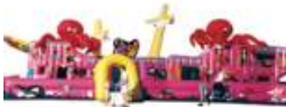
GRAND GALION GONFLABLE