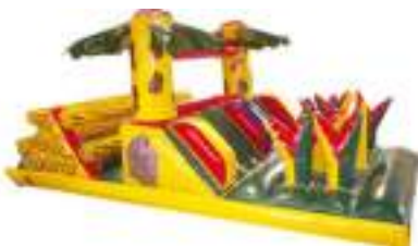
PARCOURS JUNGLE GONFLABLE