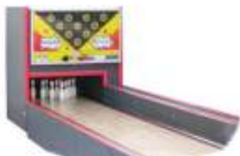
LOCATION PISTE de BOWLING américain