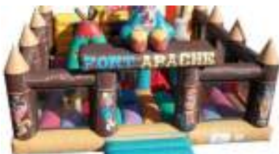
FORT APACHE GONFLABLE