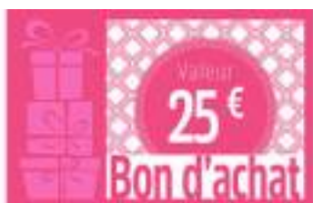
BON D'ACHAT DE 25 EUROS